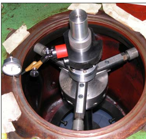
Pilot im Motorblock montieren