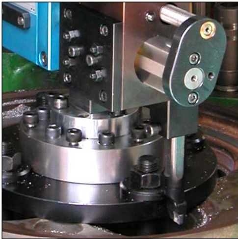
Plandrehen am Zylinderkopf